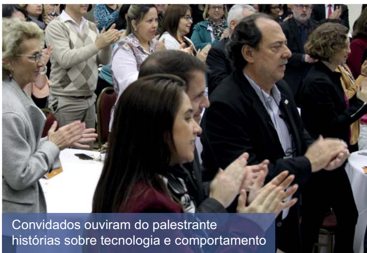
Convidados ouviram do palestrante histórias sobre tecnologia e comportamento

Crescimento de 6,7% no número de beneficiários de 2015 para 2016